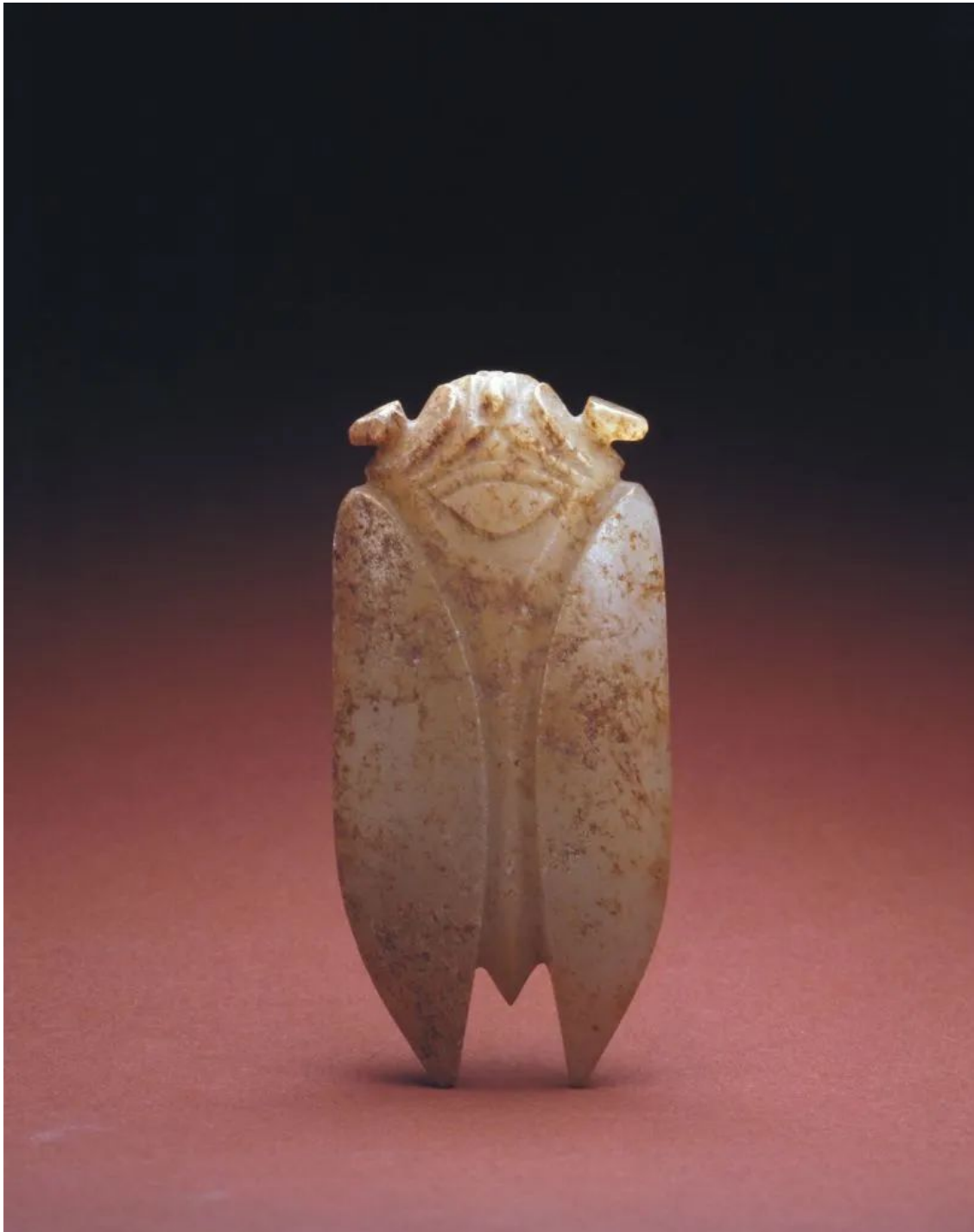
新石器时代 玉蝉 故宫博物院藏