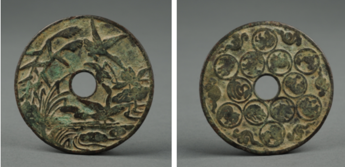
明 生肖鹭莲纹压胜铜钱 济南市博物馆藏

东汉时，一位叫刘宠的人任会稽太守，他改革弊政，废除苛捐杂税，为官十分清廉。后来他被朝廷调任为大匠之职，临走，当地百姓主动凑钱来送给即将离开的刘宠，刘宠不受。后来实在盛情难却，就从中拿了一枚铜钱象征性地收下。他因此而被称为“一钱太守”。