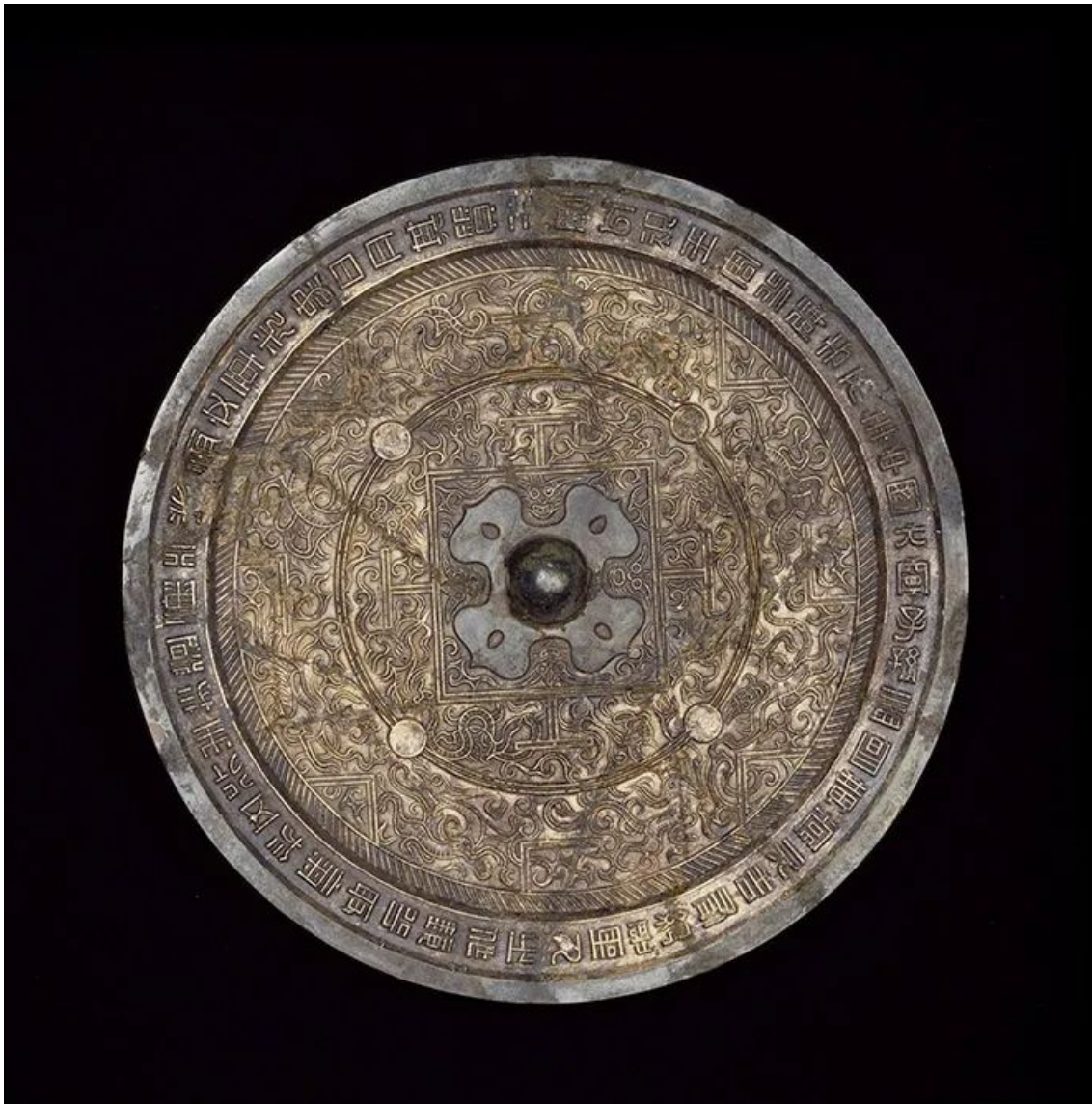
西汉 “中国大宁” 瑞兽博局纹鎏金铜镜 中国国家博物馆藏

此外，古代日常用来梳妆、照容的镜子，被赋予了反省自观、以知得失的寓意。古代仕人借镜子的洁净光明，表达洁身自好、遵守规矩的志向。