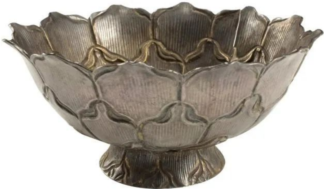
南宋 银鎏金荷花盃 镇江博物馆藏