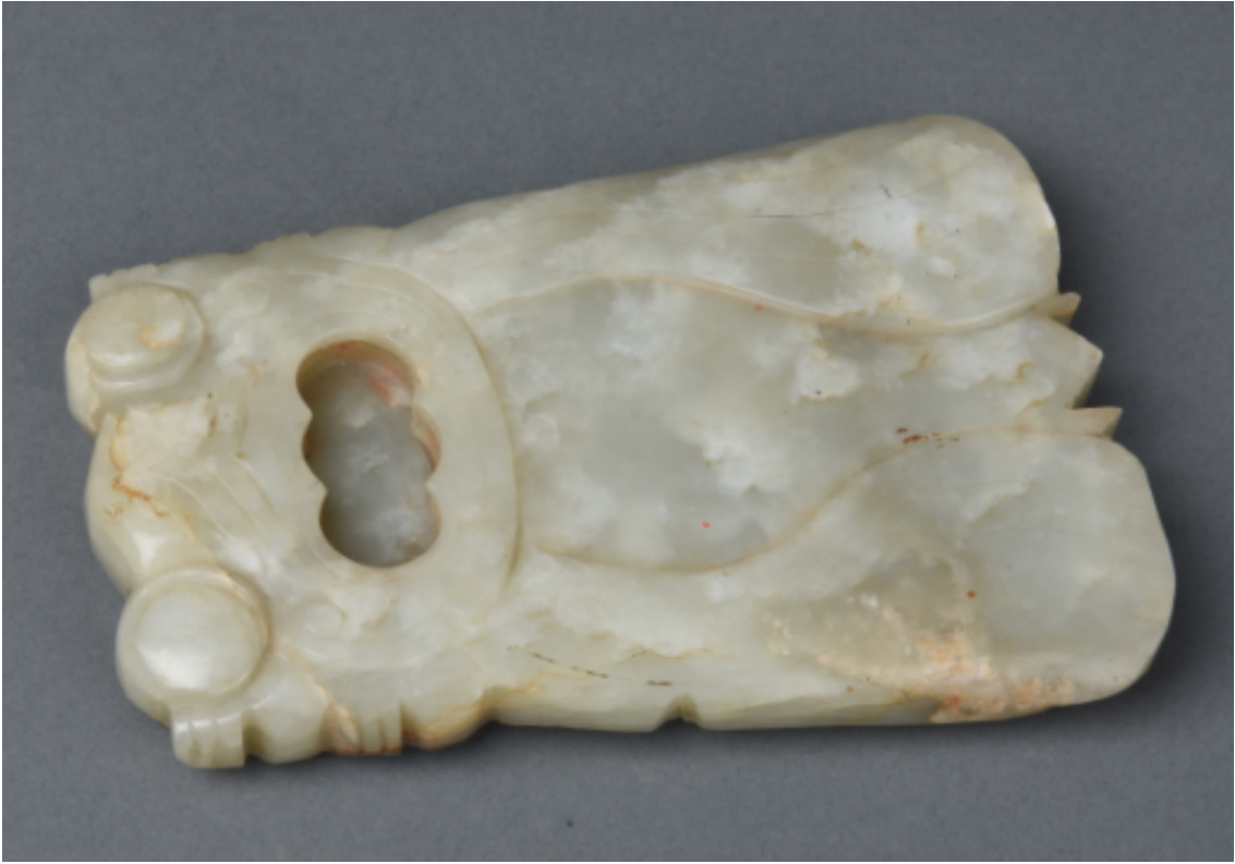
明 蝉形玉砚 济南市博物馆藏